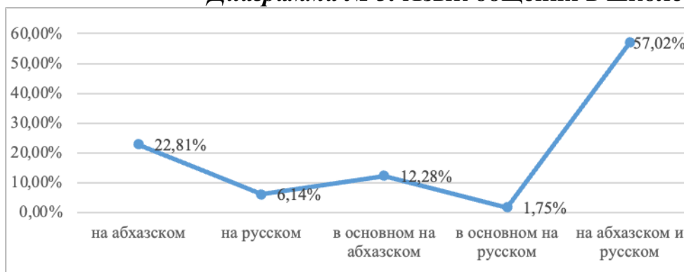
Диаграмма № 3. Язык общения в школе

В рамках проведенного нами исследования установлено, что 61% опрошенных детей использовали исключительно абхазский язык дома до поступления в школу. Их уровень владения русским языком повысился благодаря обучению в школе, что обусловило формирование искусственного билингвизма. Еще 35% свободно владеют обоими языками, поскольку освоили русский язык непосредственно в семье, являясь представителями естественного билингвизма. Остальные 4%, ранее говорившие исключительно по-русски, сталкиваются с трудностями в достижении достаточного уровня владения абхазским языком, что препятствует полноценному использованию обоих языков.